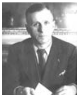
Ambroise Croizat Fondateur de la Sécurité Sociale